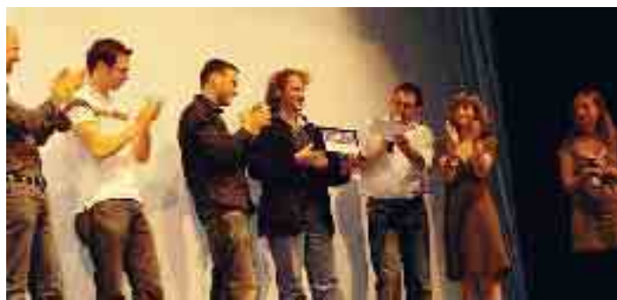
Un momento della cerimonia di premiazione del corto "Lost in Montanaro" a Ravenna