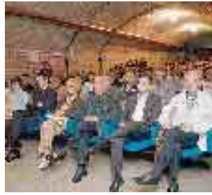
Due momenti del concerto dei Manomanouche a Borgonovo e, sopra, il pubblico